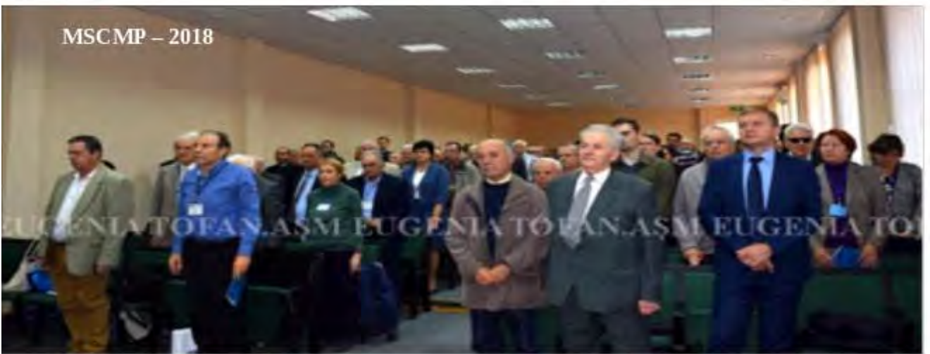
MSCMP – 2018