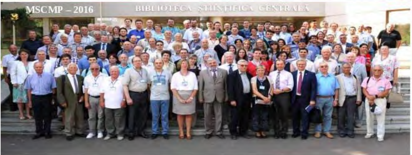
MSCMP – 2016