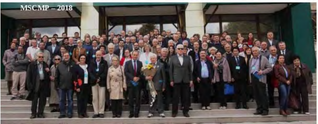
MSCMP – 2018