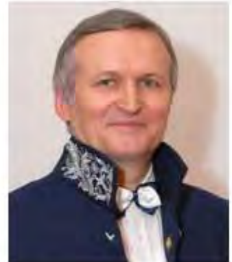
ПРЕЗИДЕНТЫ АКАДЕМИИ НАУК МОЛДОВЫ