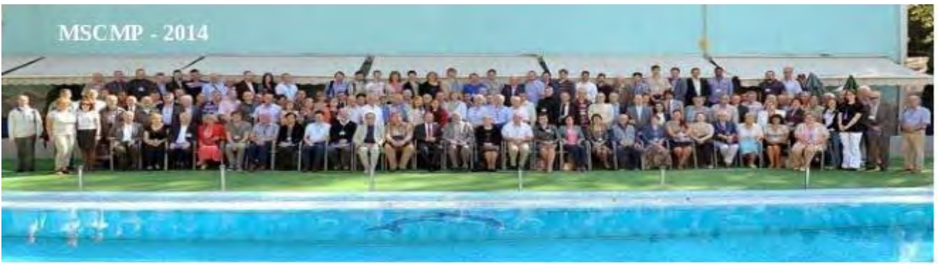
MSCMP - 2014