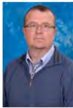
ДИРЕКТОРА ИНСТИТУТА ПРИКЛАДНОЙ ФИЗИКИ