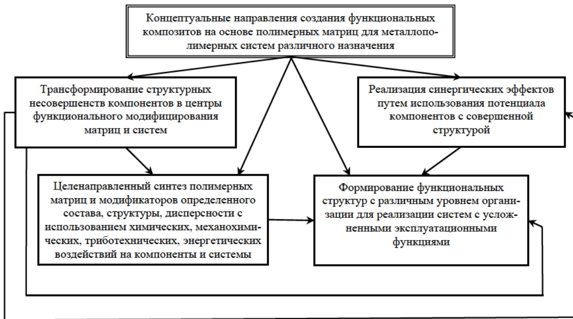
Рис. 1. Концептуальные направления создания функциональных композитов на основе полимерных матриц для металлополимерных систем.

основе полимерных матриц промышленного производства.